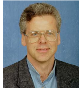
Lee S. Barbour Professor, Civil & Geological Engineering University of Saskatchewan