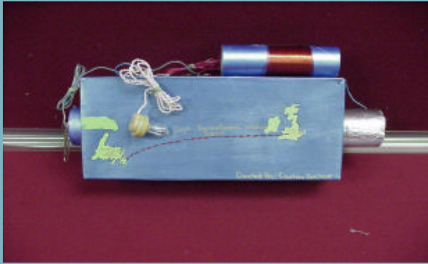
Figure 6: Le récepteur Gagnant (Au Dessus), habilement fabriqué par Mme. Courteny Barbour (Photo de droite au centre) de l'école secondaire Leary's Brook. Aussi sur la photo Vijay Bhargava (Gauche) et Wally Rear (Droite) d'IEEE Canada.