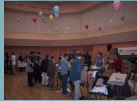
Figure 5: Salle de la compétition où les récepteurs furent jugés. Notez les ballons gonflés d'hélium supportant les antennes.