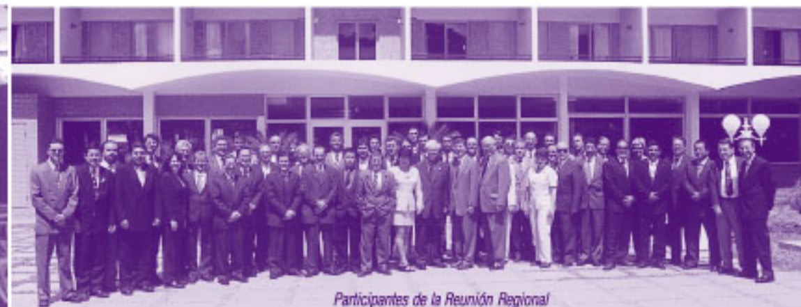
Participantes de la Reunión Regional