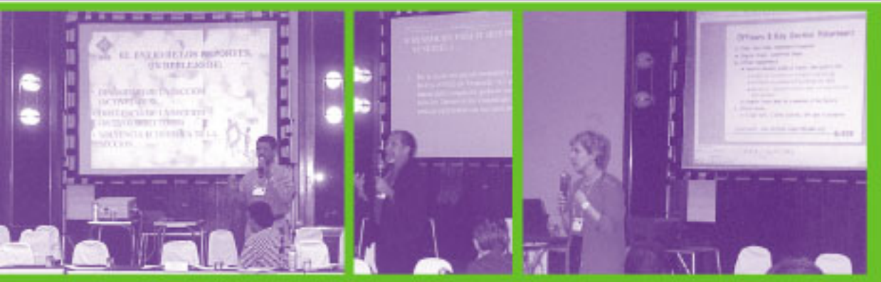
Momentos en que los participantes realizaban sus presentaciones.

Con la asistencia a la Reunión Regional los presidentes de las diferentes secciones tuvieron la oportunidad de intercambiar puntos de vista con representantes de otras secciones, a la vez hicieron contacto con los representantes de las sociedades del IEEE; concursaron para la obtención del premio al mejor logro, dotado con US$200.00 y como directivos se les entrenó sobre temas de administración de la Sección.