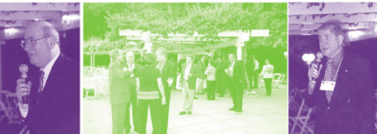
Participantes de la Reunión regional.

El comité organizador preparó una gira técnica a la Planta Hidroeléctrica de Itaipú, un proyecto binacional brasileño-paraguayo que provee 90 TWh de energía a ambos países gracias a los 18 generadores que posee. Ese mismo día se visitó el sitio de las cataratas de Iguazú, las más anchas del mundo, un paisaje natural digno de ser admirado.